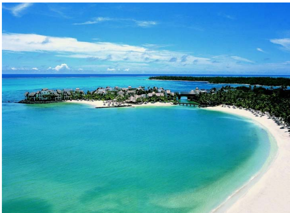
La splendida spiaggia di Bali

Al Festival di Riccione (tanto per fare un esempio) manco un medico e il rappresentante federale si è visto solo alle premiazioni.