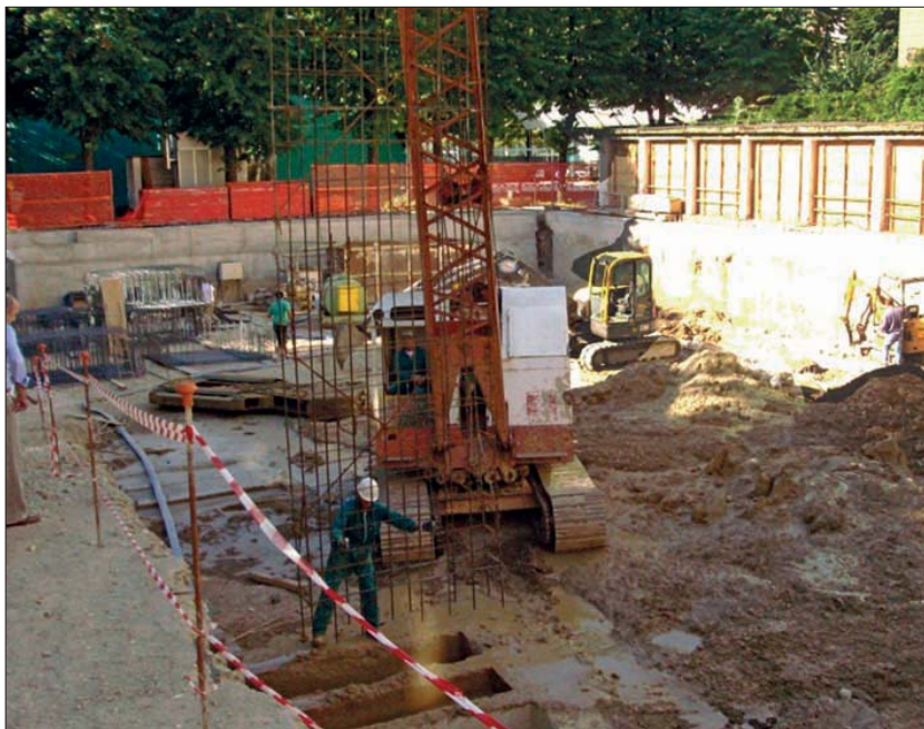
Il cantiere in pieno fermento.

va logistica offrirà. Ed oltre al logico e più razionale contenitore dei nuovi uffici, la nuova sede è certamente una grande occasione di promozione, nonché destinata ad essere centro propulsore di nuove significative attività per lo sviluppo.