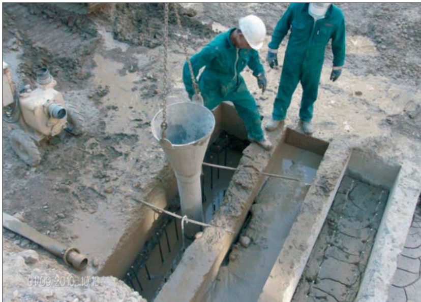
Si consolida il sottosuolo.

Dobbiamo rilevare che a parte gli interrogativi e le problematiche che spesso le fondazioni nel sottosuolo di