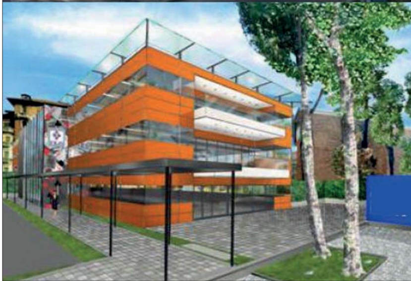
La casa del bridge (progetto BG+).

te al Moto Club). Superata la fase della pianificazione progettuale e dei vari accordi fra le parti, anche con il consenso del Congresso delle Società Sportive (Riccione), il Comune di Milano deliberava la Concessione. Il progetto iniziale prevedeva che la Casa del Bridge fosse pronta nell'autunno del 2008 ma, a causa di alcune lungaggini burocratiche, della scadenza della legislatura federale e dell'elezione del nuovo Presidente e del nuovo Consiglio, il progetto ha subito un certo ritardo. I lavori peraltro, oggi, sono in uno stato pressoché ultimativo e l'inaugurazione potrà probabilmente avvenire già nella prossima