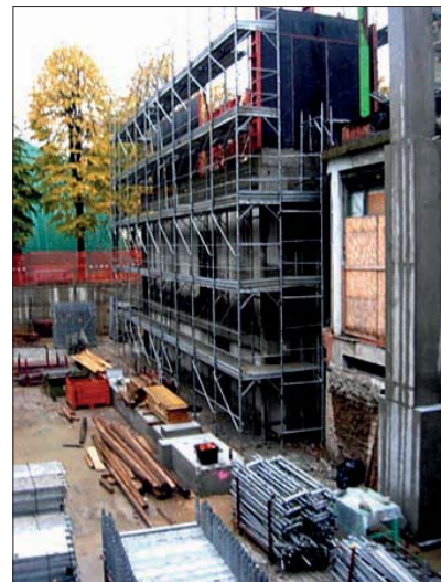
Ai piani alti (fine ottobre 2010).

A chi di dovere progettare e promuovere importanti attività giovanili, far crescere con stages e seminari in loco i nostri quadri, i nostri dirigenti sportivi, gli arbitri; dare ai nostri istruttori delle occasioni irripetibili di promuovere la loro e la nostra attività federale; e programmare, disponendo sempre di 500 mq (e volendo di altri 500mq), per cen-