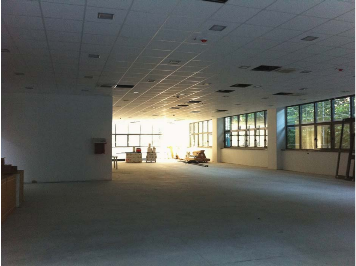
L'ampio salone al piano terra e al primo piano della palazzina