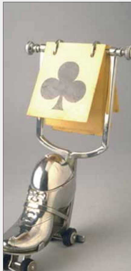
Ricordatore di atout Collezione privata BSC

Per la riuscita del contratto, il perfetto dichiarante non deve fare affidamento solo sulla favorevole posizione del Re di quadri, ma deve tentare di affrancare una fiori, facendo buon uso dei rientri se il colore è diviso 4-2. Perciò Asso, Re di fiori e fiori taglio, cuori taglio (non ci si doveva affrettare a fare questo taglio) e fiori taglio. L'Asso di quadri è lì, pronto per rientrare e incassare la fiori buona che l'avversario può anche tagliare, ma di vincente.