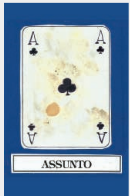
Illustration by Marina Causa

Che ne pensate di giocare la 3/3 a picche? NO! Forse vi piace di più l'impasse a cuori? NO! Va bene, volete per forza giocare il 100%. E allora intavolate la Dama di cuori per l'Asso del morto e lanciate il Re di fiori sul tavolo scartandoci con soddisfazione l'Asso di quadri! Ora potete stare sicuri di tornare al morto, prima o poi. Voi non avete fretta.